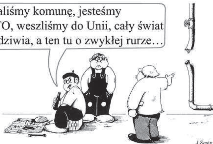
Jacek Sasin, Do Unii i z powrotem .