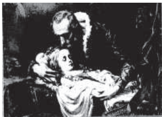
J. Matejko, "Jan Kochanowski nad zwłokami Urszulki"