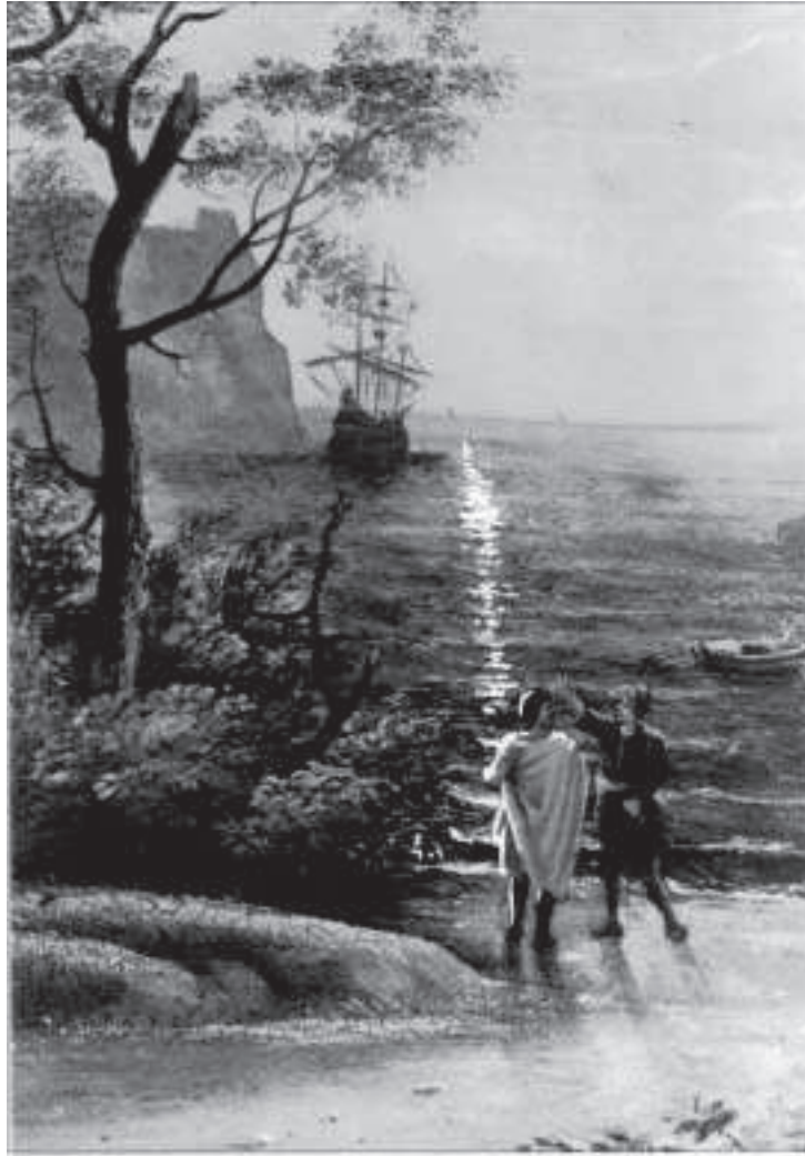
Claude Lorrain Marzenia wędrowca (detal ze sceną pożegnania)

Waldemar Łysiak, MW , Kraków 1990, s. 49