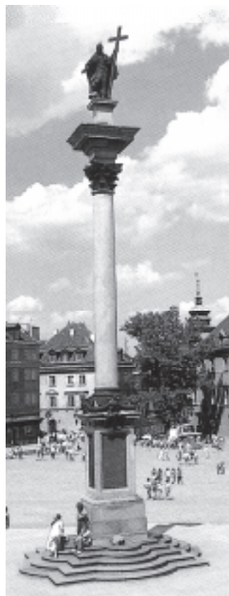
Kolumna Zygmunta III Wazy w Warszawie