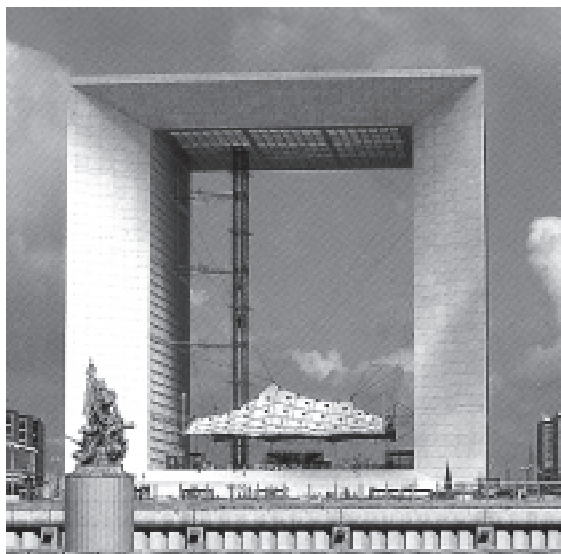
Wielki Łuk w dzielnicy La Defense w Paryżu